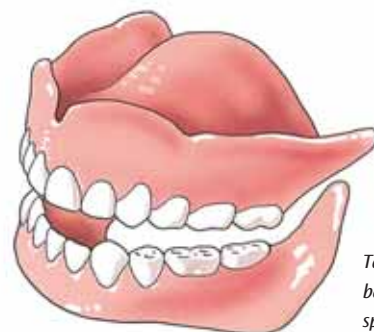
Tanden en kiezen zijn belangrijk voor het kauwen, spreken en het uiterlijk

Als u in de spiegel kijkt, moet u waarschijnlijk erg wennen. Uw mond is nu een maal een belangrijke blikvanger en die is veranderd. Neem een paar dagen de tijd om te wennen en beoordeel pas dan hoe u er met uw nieuwe tanden en kiezen uitziet.