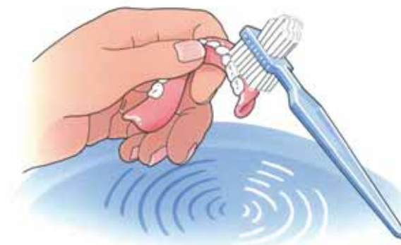
Reinig uw kunstgebit na iedere maaltijd

Uw kunstgebit is nu nog nieuw en mooi. Dat wilt u natuurlijk graag zo houden. Daarom moet u, net als bij eigen tanden en kiezen, uw kunstgebit verzorgen. Als u het niet regelmatig schoonmaakt, blijven er voedselresten achter. Zowel op uw kunstgebit als eronder. Als u die niet verwijdert, kan uw tandvlees op den duur gaan ontsteken. Reinig uw gebit daarom zorgvuldig na iedere maaltijd. Gebruik een speciale protheseborstel, bijvoorbeeld van Lactona of Oral-B, en water om etensresten goed te verwijderen. Gebruik géén tandpasta. Die kan te veel schuren. Een schoon kunstgebit voelt altijd glad aan. Laat uw gladde gebit tijdens het reinigen niet uit uw handen glijpen. Het zal kapot gaan. Vul voor de zekerheid eerst de wasbak met water en reinig uw gebit daarboven.