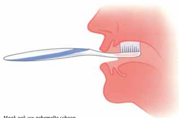
Maak ook uw gehemelte schoon

Houd behalve uw kunstgebit ook uw mond schoon. Spoel in het begin, als de wonden nog niet helemaal zijn genezen uw mond na elke maaltijd met een beetje lauw water. Daarna kunt u uw tandvles beter met een zachte tandenborstel poetsen. Gebruik daarvoor gewone fluoridetandpasta. Masseer met een zachte tandenborstel minstens één keer per dag het slijmvlies waarop uw kunstgebit rust: uw kaken en de overgang van de kaak naar de wangen. Poets ook uw gehemelte, want ook daar kunnen voedselresten zitten.