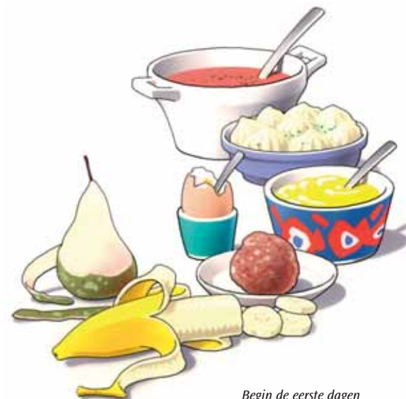
Begin de eerste dagen met zacht voedsel

Eten met uw nieuwe kunstgebit is wat onwennig. Zeker in het begin zult u voorzichtig aan doen. U ervaart zelf het beste wat wel en niet kan. Neem de eerste dagen zacht voedsel, zoals puree, gehakt en zacht fruit. Probeer enkele dagen daarna een stukje vis en een aardappel. Weer later kunt u voedsel eten zoals vlees of een appel. Stukken afbijten kunt u met een kunstgebit beter niet doen. Snijd uw voedsel daarom in stukjes en kauw rustig en gelijkmatig met uw nieuwe kunstkiezen. Neem daarbij aan beide zijden een stukje voedsel in de mond. Neem er iets meer tijd voor dan dat u gewend was.